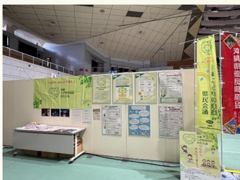
●パネル展を実施 @武道館