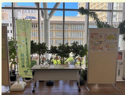
@カフーナ旭橋A街区 3階県立図書館前