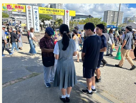
●興南高校の皆さまと募金活動を実施