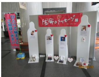
県庁におけるパネル展(命のメッセージ)