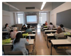
弁護士による被害者支援