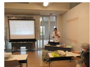
電話相談の実際とロールプレイ