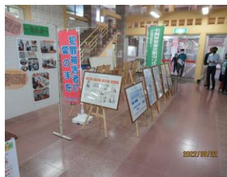
名護市役所におけるパネル展