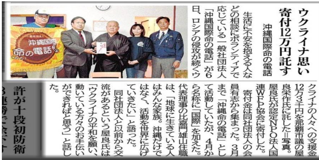
ウクライナへの支援金寄付