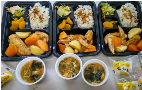
毎回メニューを変えてお届け！