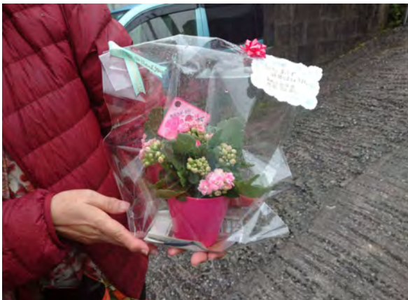
お花を持って訪問！おばあ、喜んでくれるか