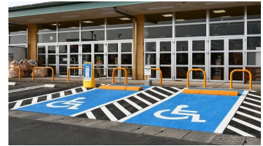
③車椅子駐車スペースの青色塗装キャンペーン