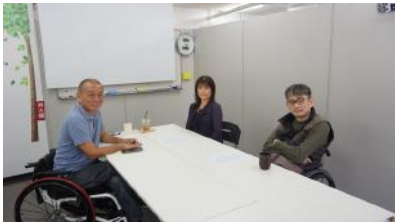
①テレワーク座談会