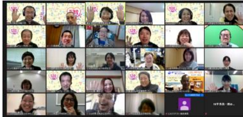
②障がい者支援関係者オンライン交流