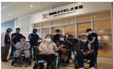
④かりゆし水族館見学