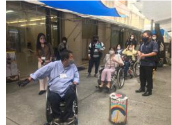
③まちなかで車いす体験講習会