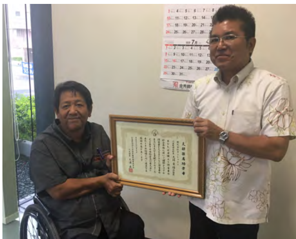
▲授賞式の様子がこちらです。

サンシャインゆいま～るの登録団体の「NPO 法人沖縄県脊髄損傷者協会」様が出席された第17回総会石川県大会にて、沖縄支部推薦功労者としてサンシャインゆいま～る活動が感謝状を拝受いたしました。