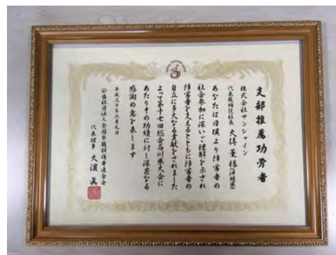
▲頂いた感謝状はこちらです。ありがとうございました。