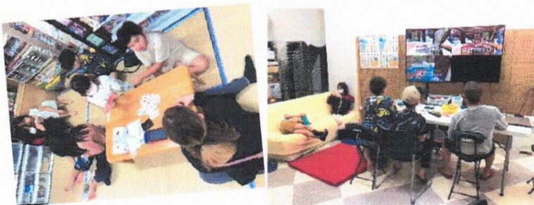
みんな思い思いに過ごします。