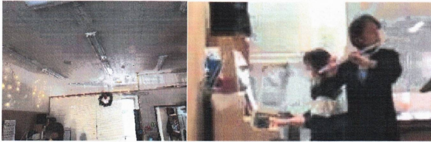
12月 今年のクリスマス会は、ピアノとフルート合奏をしました。あとはケーキを皆でデコレーションをして楽しみました。