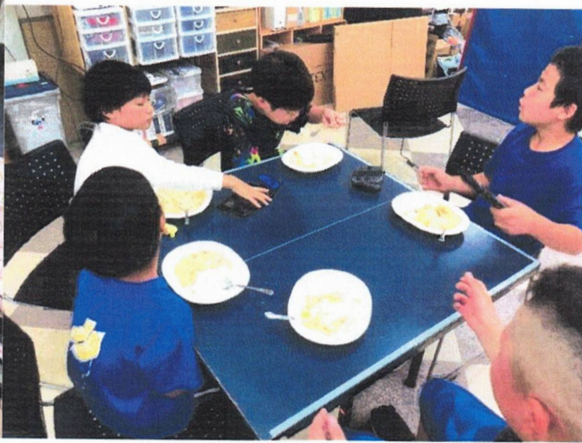
みんなで食べるとおいしいよ。食事風景