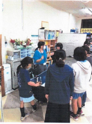
11月はハンドベルの練習で一生懸命